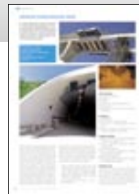
► advertorial – ukázka

vydavatel právo použít podklady objednavatele uveřejněné v některém z předcházejících titulů.